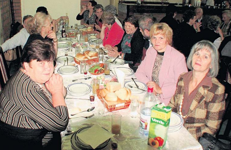
Весело за трпезом и...