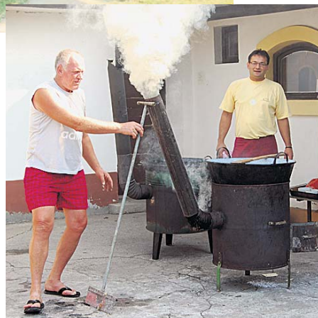
А гулаш се кува

Око 150 чланова организација из Апатина, Бачке Паланке, Бечеја, Бача, Бачке Тополе, Бачког Петровца,