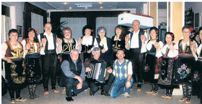
КУД „Пензионер” из Петровца