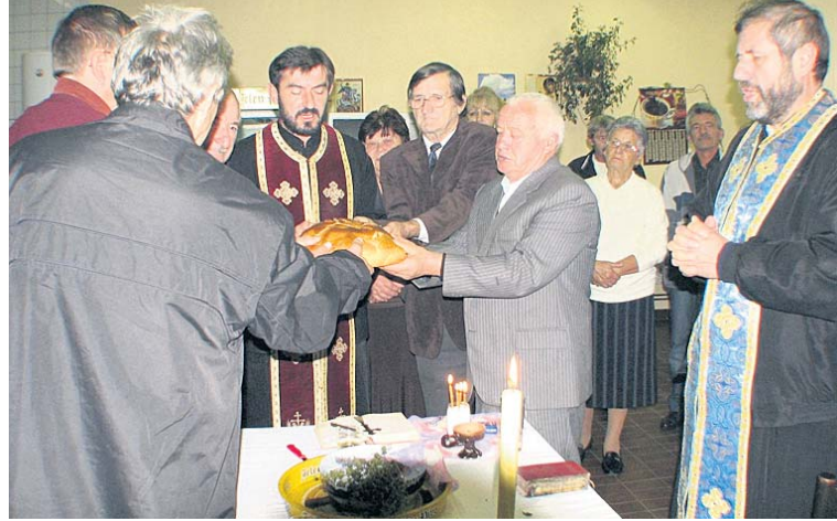
Детаљ са освештања славског колача и жита