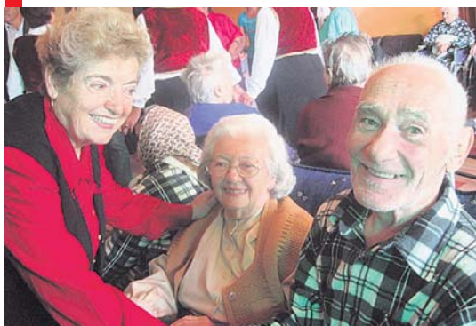
Дружење с гостима