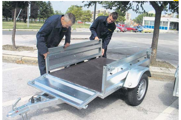
Производе и за извоз

До сада је предузеће производило делове и сетове алата за све моделе путничких аутомобила, доставних возила и камиона марке „за-