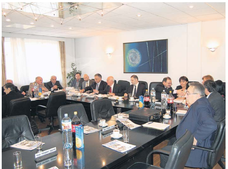
На седници усвојен шестомесечни финансијски план