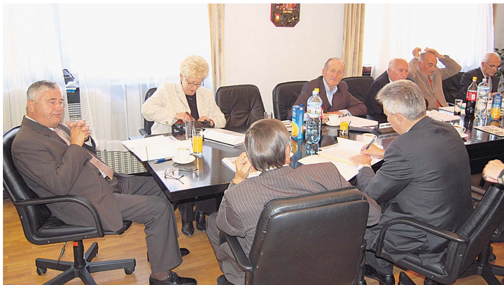
Чланови Управног одбора пажљиво слушају податке о каси Фонда

онера самосталаца стајала је Републички фонд 13,65 милиона динара, а за осигуранике самосталних делатности 632.000 динара. За