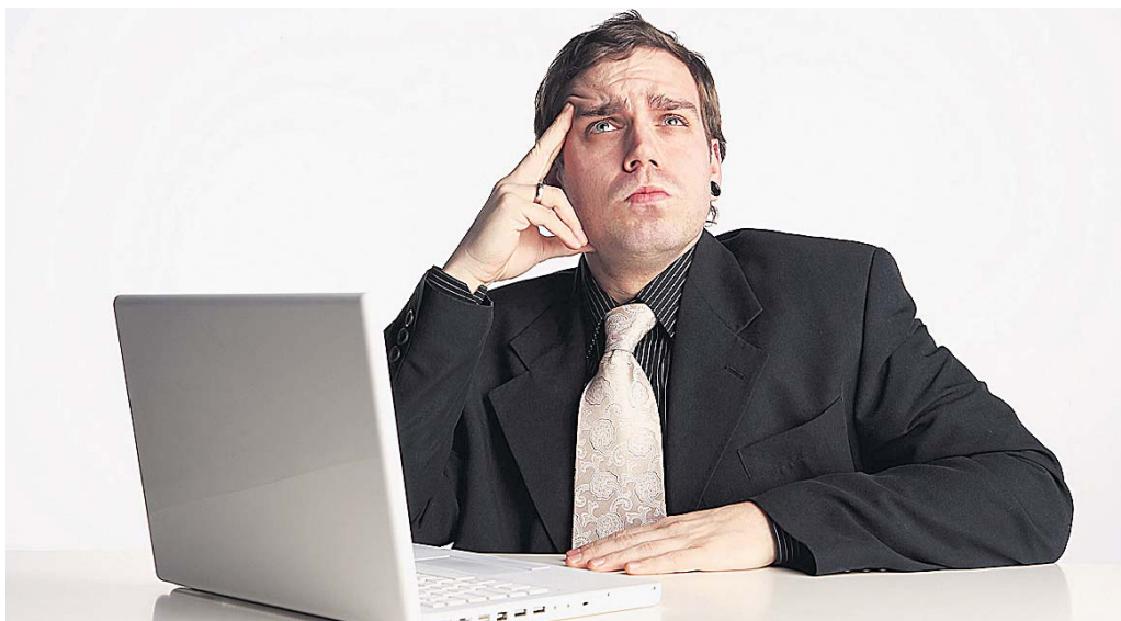
Да не закасим за упис...

ку својства осигураника. То значи да осигураник треба да поднесе захтев (који ће добити на шалтеру или скинути са сајта www.pio.rs ) за доношење таквог решења. Уз захтев треба да приложи потврду о уплаћеним допри-