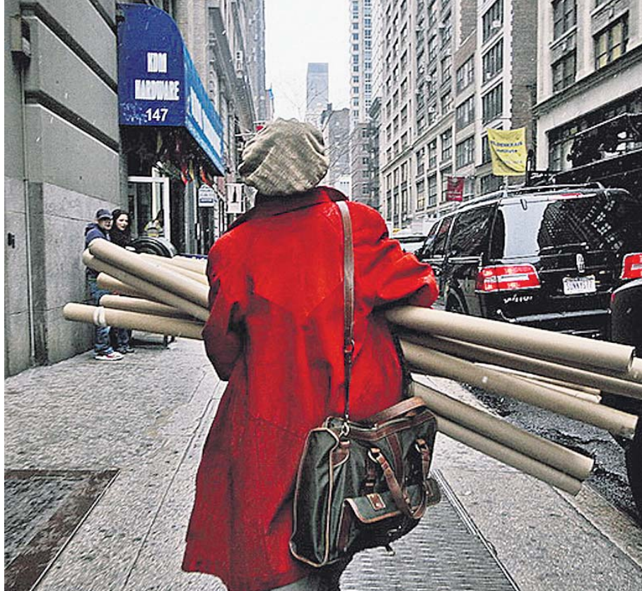
ЖЕНЕ У СРБИЈИ НАЈЗАД МОГУ ДА ОДАХНУ