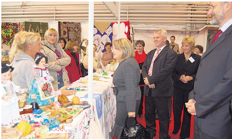
Гаскање са председницом парламента

Свако ко је тога дана дошао у Мастер центар могао је, шетајући од штанда до штанда, да ужива свим чулима. Међу 450 учесница изложбе и њихових 150 поставки било је толико разноликости – у годинама, ношњама, изложеним радовима, храни