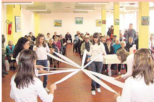
Програм за баке и деке

скромне поклоне. Међутим, како су часне старине рекле, важнија им је била посета и лепа реч од било каквих поклона. Ученици Основне школе „Јеврем Обреновић“ извели су програм којим су разгалили срца бакама и де-