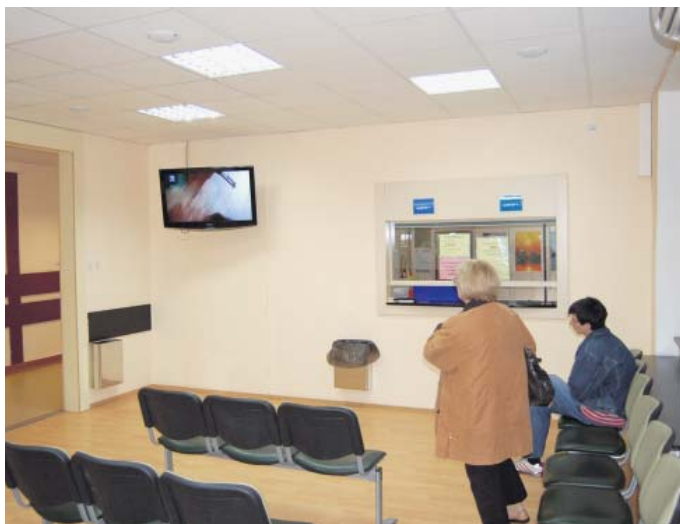
Док се не дође на ред, нешто се и научи

У првој половини године 28 лекара вештака Фонда имало је 68.101 предмет (31.257 пренетих из прошле и 36.844 примљена у првих шест месеци ове године), а решења су донета за 41.840 осигураника. Истовремено је од 15.767 пристиглих жалби (пренето 3.633, новопримљено 12.134) у првој половини године решено 11.770. Треба напоменути да лекари из Фонда вештаче и осигуранике и кориснике који преко центара за социјални рад подносе захтеве за утврђивање степена телесног оштећења и потребе за туђом негом и помоћи. Они, у ствари, према речима наше саговорнице, „четири дана у недељи раде