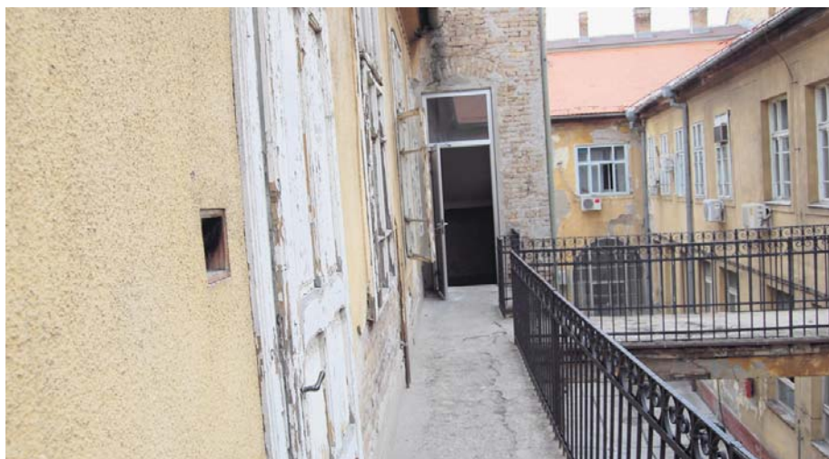
Дворишни део старе...

Наш саговорник најављује да ће се планом набавки за наредну годину предвидети изградња рампи за премештање архитектонских баријера