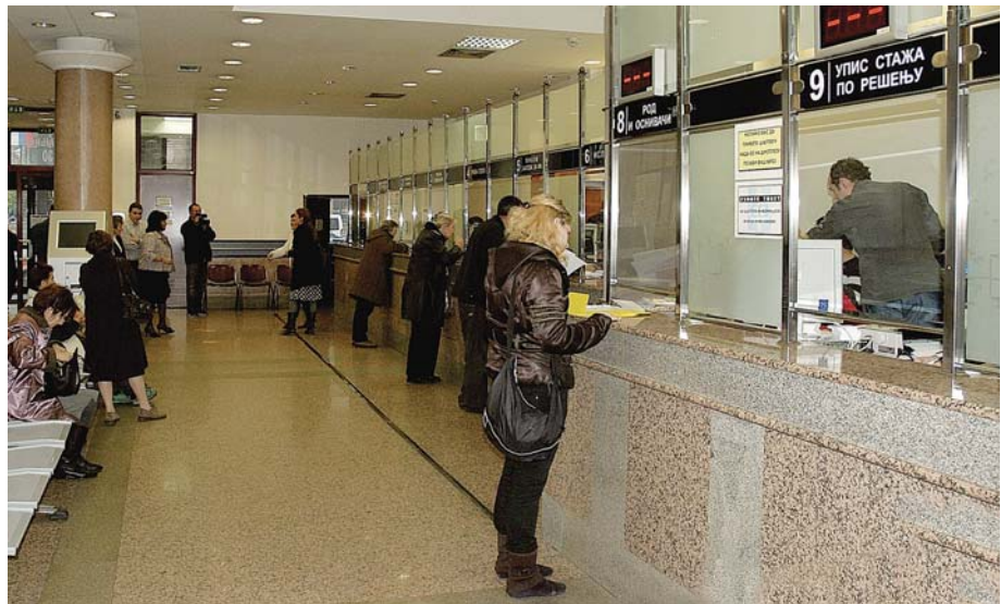
Овако је било у предвечерје у Немањиној 30

ПОЧЕО ПРОДУЖЕНИ РАД ШАЛТЕР САЛА У ФИЛИЈАЛИ БЕОГРАД