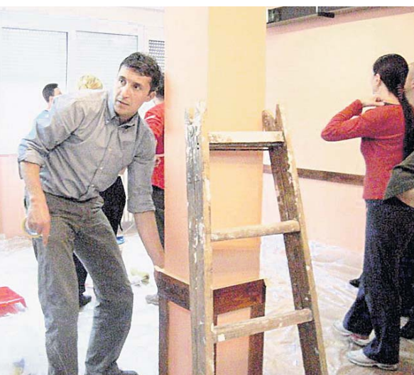
Крече и Словенци