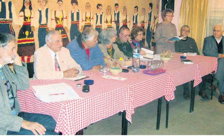
Аплауз стиховима трећег доба