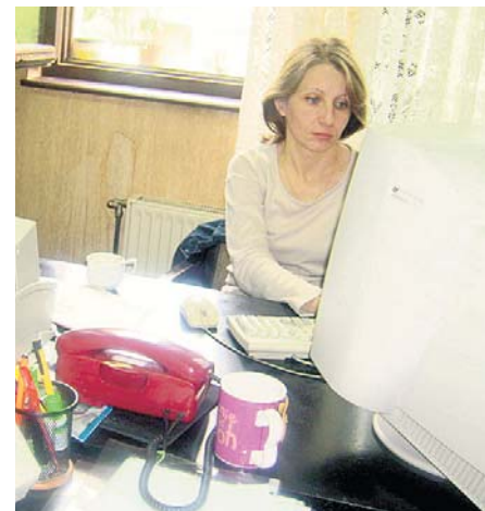
Извештај о дневним активностима

– Код мене данас нема посла, све је чисто од прошлог пута, имам само једну молбу и то морате да ми учините – хоћу да попијем кафу с вама и да мало попричамо.