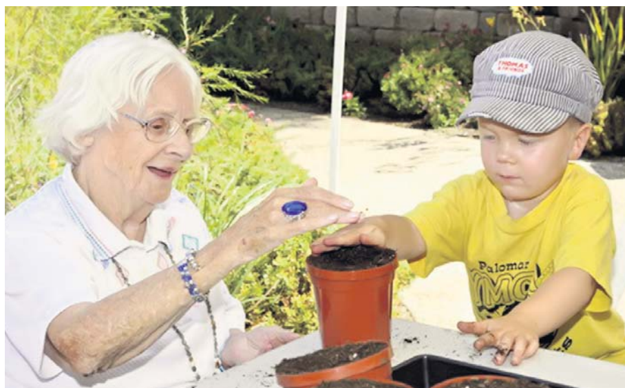
Време проведено заједно користи и једнима и другима

Све ово објашњава растућу популарност пројекта „Једна генерација“, који је пре двадесетак година лансирала истоимена непрофитна организа-