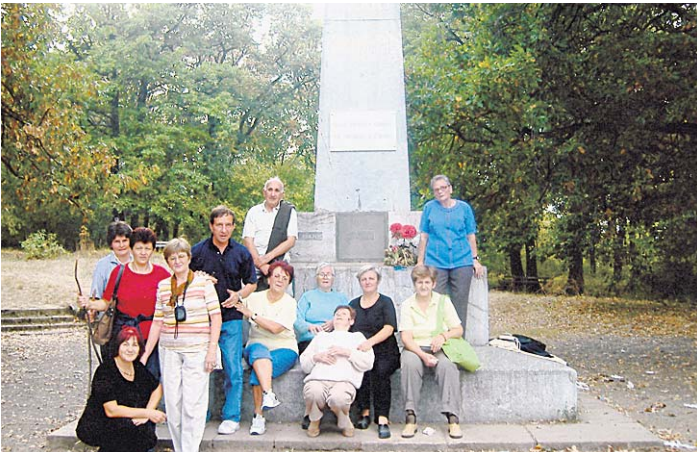
Код споменика Бранку Радичевићу

Војни пензионери из Сремске Митровице уграбили су леп јесењи дан и провели га у Сремским Карловцима. Осим домаћина из братског удружења, сачекао их је и туристички водич, па су сазнали многе чињенице о историјату и културним знаменитостима ове љупке варошице.