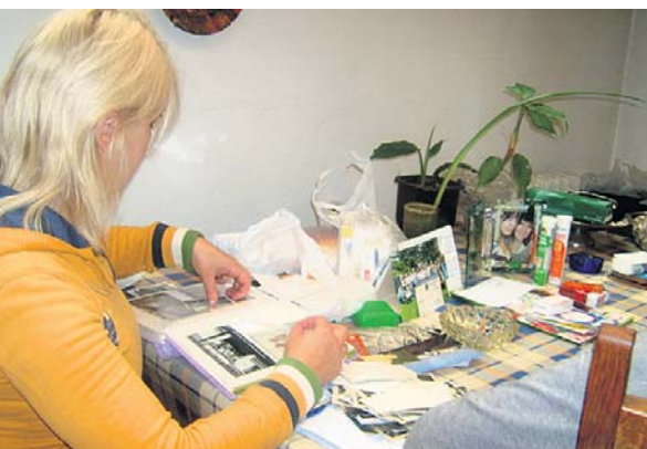
Слагање слика у албум