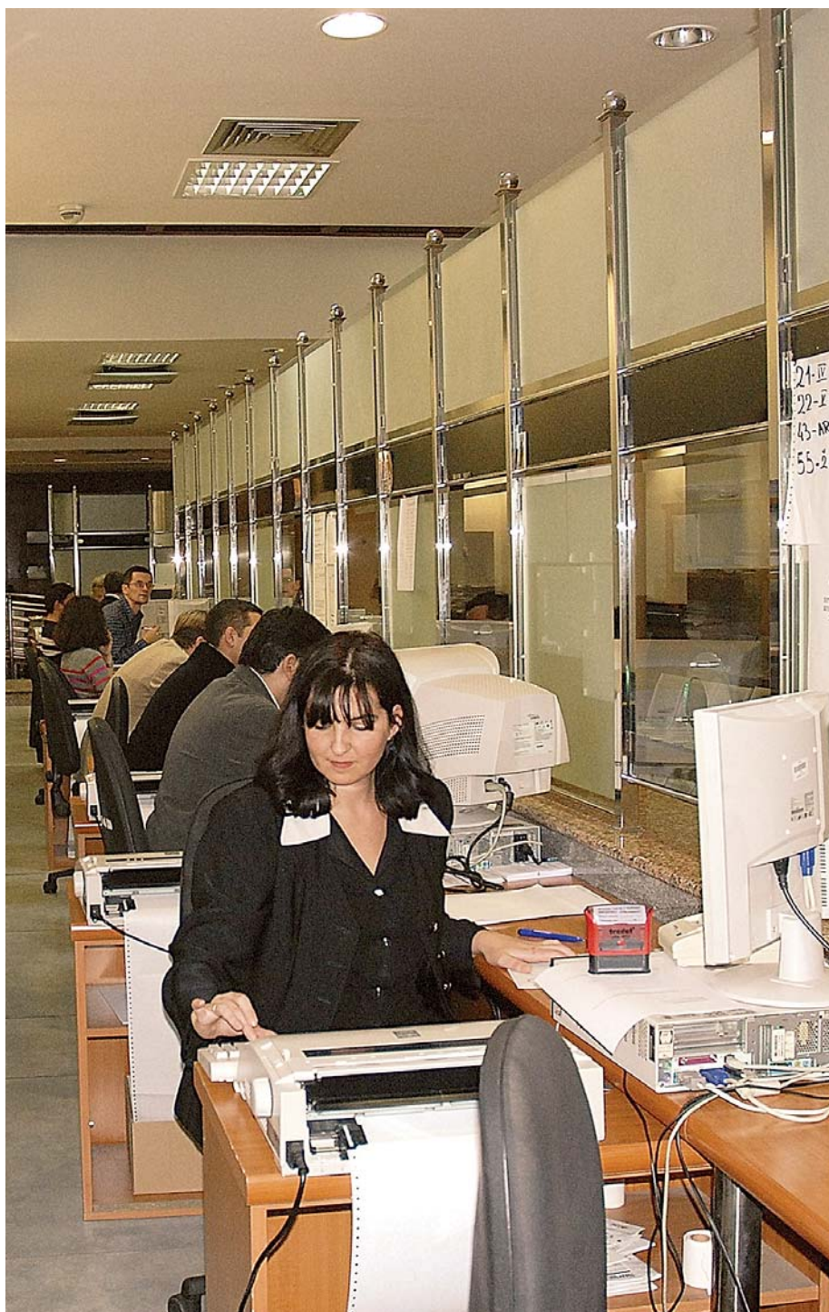
У понедељак, 9. новембра, стартавао поподневни рад у Филијали Београд

ГОДИНА ХLI • БРОЈ 21 • БЕОГРАД, 15. НОВЕМБАР 2009. • ИЗЛАЗИ ПЕТНАЕСТОДНЕВНО • БЕСПЛАТАН ПРИМЕРАК