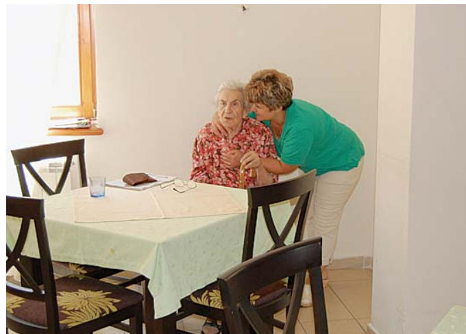
Да не буду сами

године. Новац је обезбедила Европска унија (645.000 евра), немачки огранак Каритаса и влада те земље (више од 500.000 евра). Циљ програма је био да покажемо да старији и болесни људи могу да остану у својим кућама