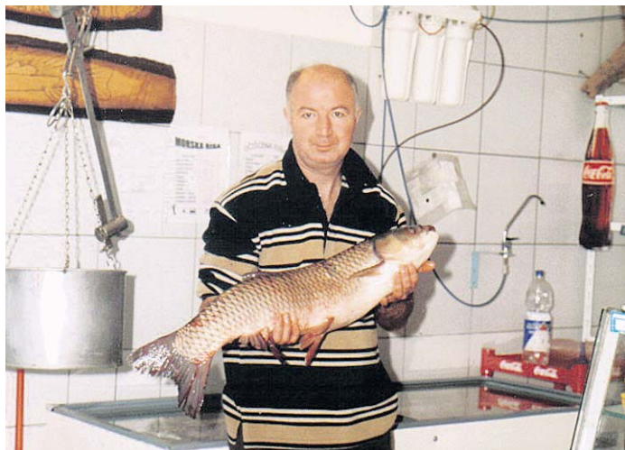
Стиже време посних слава