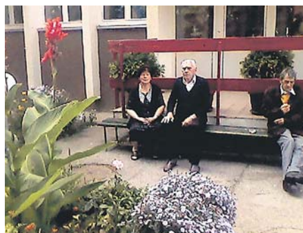
И треће доба може да буде лепо

Иначе, за смештај у овом центру влада велико интересовање грађана не само Поморавског округа. У