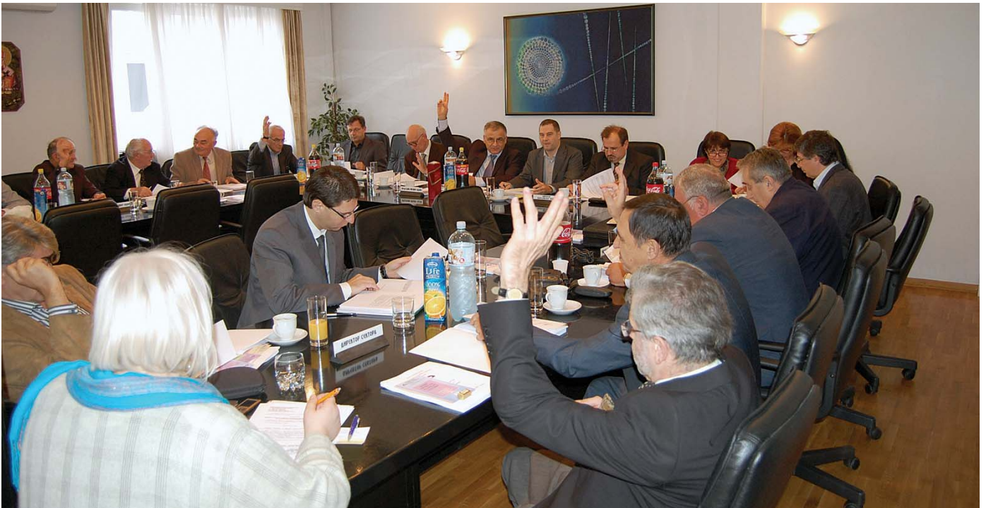
Детаљ са седнице

Уместо са досадашњих 14 месеци, нека радна места биће „покривена“ са 15 и 16 месеци – одлучио Управни одбор Републичког фонда ПИО