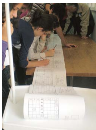
Буквално баш мамутска укрштеница

ћим истраживачима и љубитељима праисторијских животиња. „Квиз из доба јуре“