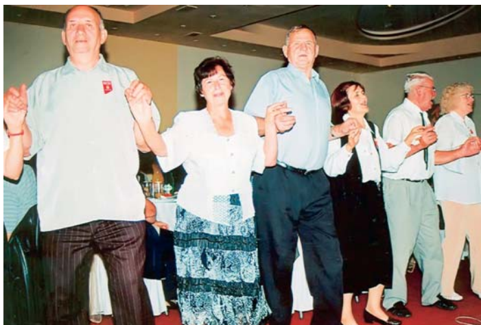
Било је и песме и игре