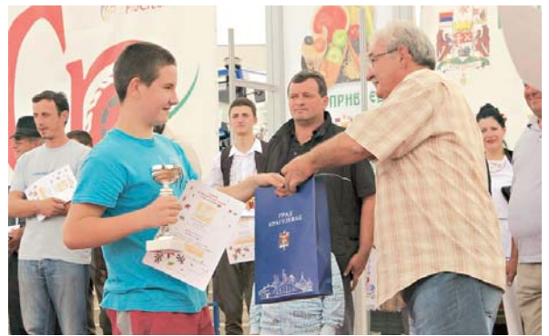
Награђени добијају признања