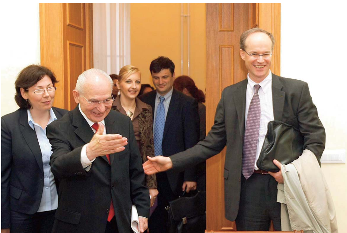
Потпредседник Владе са делегацијом ММФ-а

Оваквим организовањем и сарадњом ПУПС-а и Савеза пензионера можемо дати изузетан допринос развоју Србије и стварању праведнијег друштва у складу са цивилизацијским тековинама и функционисањем најбоље организованих држава Европе.