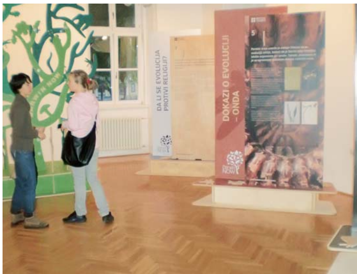
Део изложбе „Дарвин данас“

Остаци мамутице, једни од најзначајнијих у свету, изложени у Народном музеју у Кикинди, откривени су пре четрнаест година у глинокопу у близини овог града. Пре неколико године израђена је и пластична реплика те мамутице коју су деца назвала Кика. Ове године у њену част одржан је четврти Мамутофест.