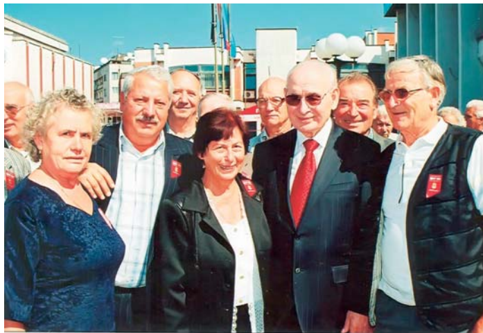
Др Јован Кркобабић са пензионерима

Ветерани из пензионерских организација и удружења из ових округа дошли су у Пирот да се виде и поздраве, да се друже и да чују свог председника, др Јована Кркобабића, потпредседника Владе Србије и председника ПУПС-а. Многи од њих су први пут дошли у овај град на Нишави, и нису се покајали јер се тог лепог сунчаног дана чинило да град и грађани Пирота живе за своје госте. Све је било подређено њиховом пријему и дочеку, који је организовало Општинско удружење пензионера, уз несебичну помоћ општине и најодговорнијих људи у њој. Поред њих, организацију овог догађаја помогли су Филијала РФ ПИО у Пироту и „Дунав осигурање“.