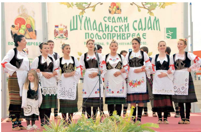
За посетиоце сајма приређен је богат програм