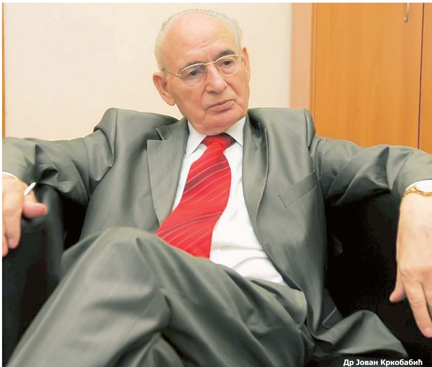
Др Јован Кркобабић