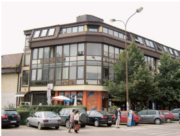
Седиште Општинске организације