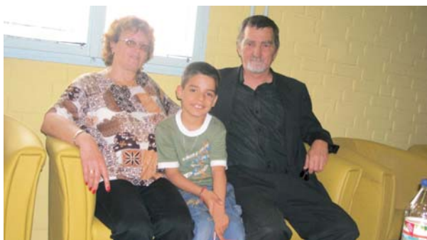
Душан са новом породицом