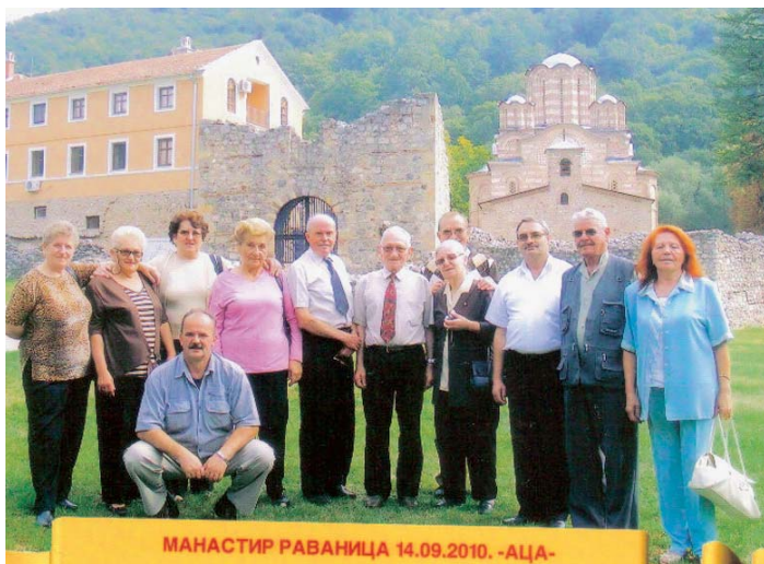
Са последњег излета у Раваницу

По његовим речима, успешан рад прокупачке организације, о коме често пише „Глас осигураника“, побудио је интересовање других удружења да сарађују и да се друже са Прокупчанима, тако да врло често стижу и позиви у госте.