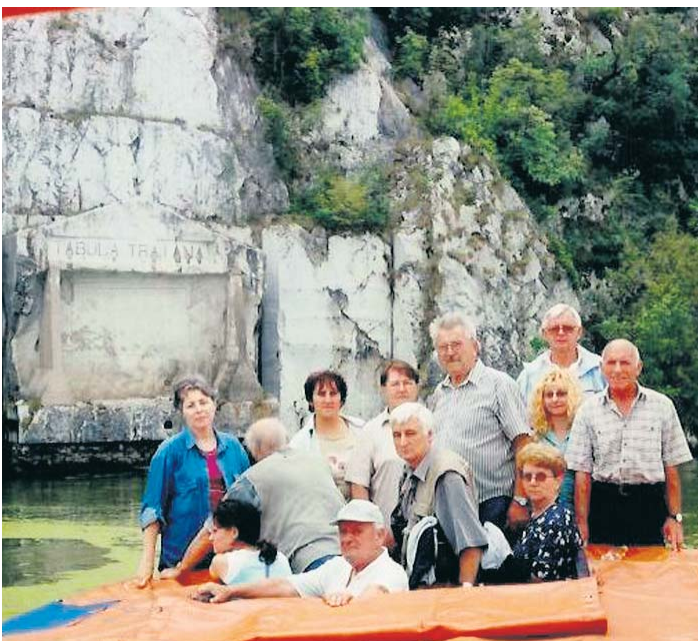
И Трајанова табла је на листи споменика културе

У ЗАЈЕЧАРУ ОБЕЛЕЖЕНА 40. ГОДИШЊИЦА КОНВЕНЦИЈЕ О ЗАШТИТИ СВЕТСКЕ КУЛТУРНЕ И ПРИРОДНЕ БАШТИНЕ