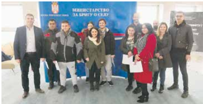
Са потписивања уговора у децембру 2023.

– Убрзо стартује и програм намењен житељима села који реше да покрену или прошире сопствене најразличитије послове. За то могу да рачунају на помоћ у износу до 10.000 евра.