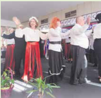
Први Лесковчанима пожелели срећну Нову годину

ДРУГИ СВЕТОСАВСКИ ШАХОВСКИ ТУРНИР У ГРАЧАНИЦИ