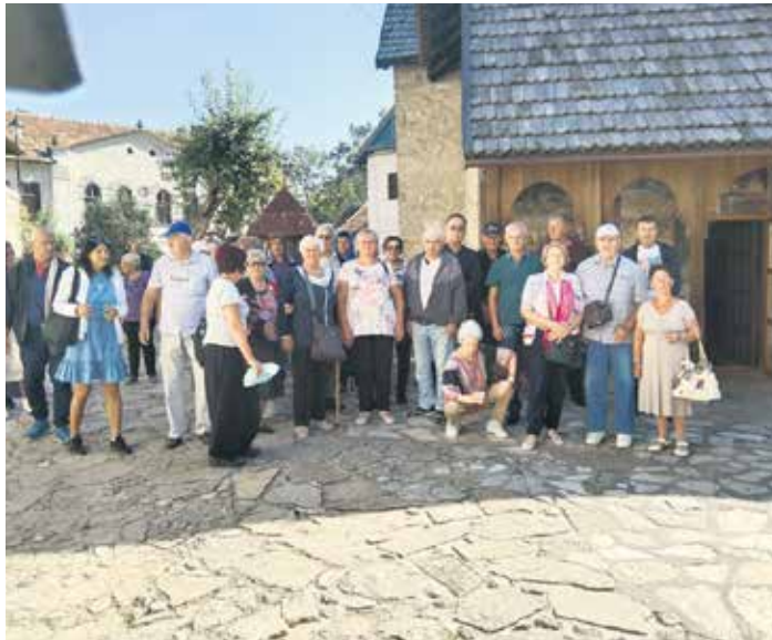
Са једног од излета у прошлој години

Посредством Републичког фонда ПИО за хуманитарне пакете за пензионере са нај-