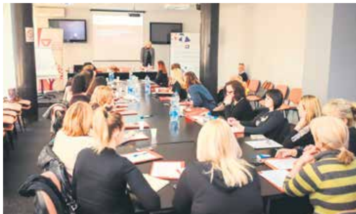
Са једне од радионица Удружења