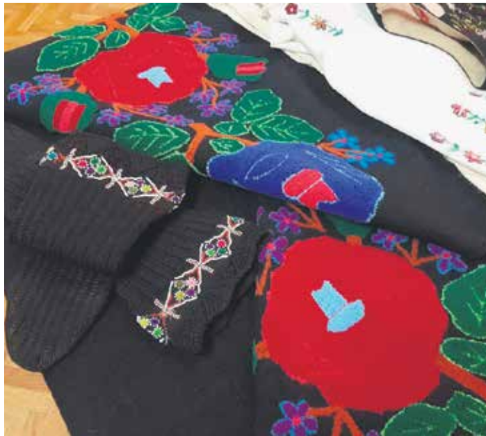
Рубан ћилим са четири цвета стар 80 година