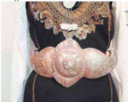
Гравирани метални појас за ношњу

– Пчињски округ има пет различитих етнолошки подељених области. Свака од њих има неколико варијанти ношње у женској и мушкој форми. Плус стари и нови тип. Човек лако може да се збунује када треба да одреди који комад чему припада. Ношње заиста представљају