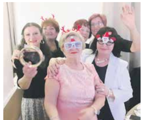
Веселе и распеване чланице ГОП Пирот

– Ово је заиста за памћење и незаборав. Дочек Нове 2024. године неће никада да избледи у мом сећању. Заиста је предивно. Веселили се и ћаскали, на неки начин резимирали смо све досадашње дочеке. По