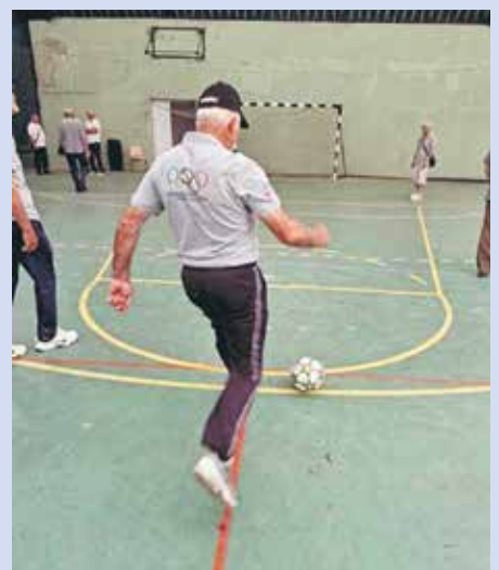
Надметање у шутирању пенала је једно од најатрактивнијих

После такмичарског дела и доделе признања организовано је дружење које је, судећи по атмосфери и расположењу учесника, било најбољи и највеселији део манифестације. Пензионери су јединстве-