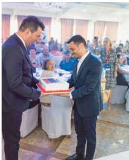
Поклон од локалне самоуправе Шапца