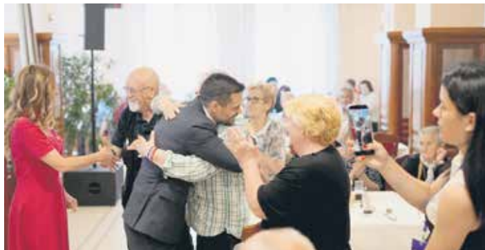
Срдчан дочек у београдској општини Вождовац