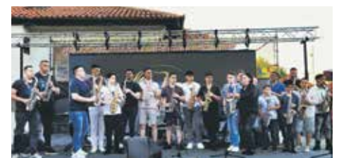
У лесковачком крају много младих је заинтересовано за саксофон

Најмлађи учесник овогодишњег фестивала саксофониста у Лесковцу био је седмого-