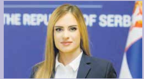
Министарка Милица Ђурђевић Стаменковски

Министарка за рад, запошљавање, борачка и социјална питања, Милица Ђурђевић Стаменковски, истакла је да је реч о једном од најважнијих законских решења у области социјалне политике у последњим деценијама. Она је нагласила да је усвајање Предлога закона велика победа свих породица које су