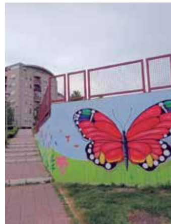
Мурал осликан на зиду дечјег игралишта

Поред сарадње са „Kappa Star Recycling“ компанијом, подршку им пружају и „Ekostar Pak“, „Свака лименка се рачуна“ и „FabriQa“ са којом је до сада у два наврата организована рецикла-