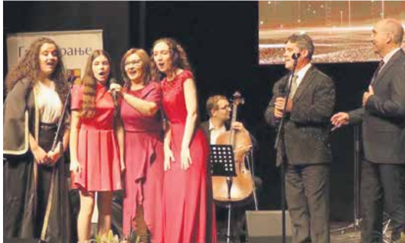
Манифестација је посвећена очувању аутентичне музичке традиције Врања

Несумњиво је да староградска песма одражава сећање на културу и урбани контекст у коме су живели становници Врања у другој половини 19. и почетком 20. столећа. У национални регистар нематеријалног културног наслеђа Србије врањска староградска песма уврштена је 2012. године. Сетним, тихим и мирним стиховима ове песме на особен начин описују живот, обичаје и љубави које су се рађале и нестајале. Лаганим и спорим ритмовима буде најдубље осећаје, а садржина сваке песме односи се на конкретна места, личности и догађаје. Врањском песмом из прохујалих времена стиче се јасан увид у варошку