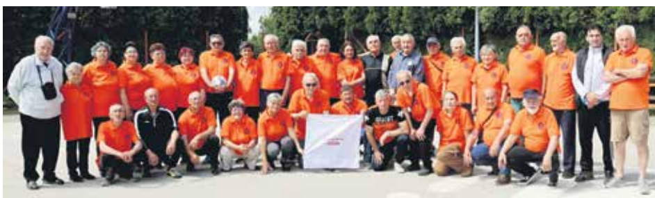
Борбе су биле фер али истрајне и пожртвоване

По завршетку Олимпијаде прешло се на Народни вишебој, за који су такође биле