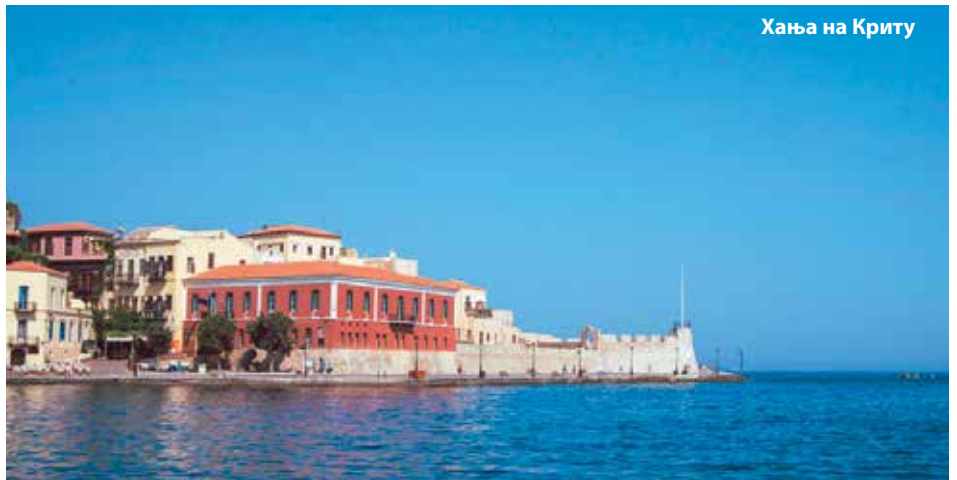
Хања на Криту

Ни добијање боравка није компликовано, а сви „досељеници“ се слажу да Грчка тихо мења начин на који живе. Није то само ствар климе, већ став да се живи полако, уз комуникативну заједницу и свакодневну везу с природом.