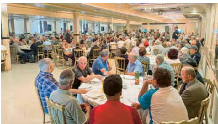
Више од 550 пензионера присуствовало је трибини у Крушевцу

– Добио сам велики број мејлова и позива, чак и од председника Републике, и моја наредна обавеза јесте да се не заврши на 60 трибина него да буде и више, што значи да очекујемо разговоре са 25.000-30.000 пензионера и мислим да је то прави начин како можемо заједно да направимо, као један