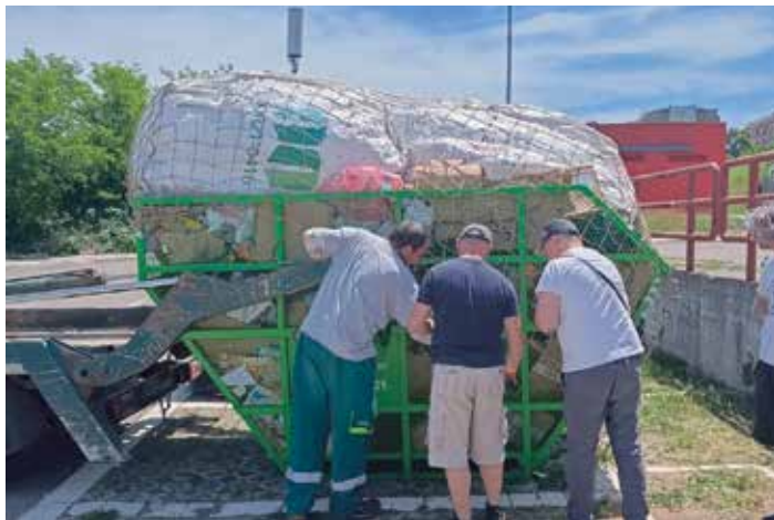
До сада је предато на рециклажу више од шест тона отпада

– „Степиклажа“ је рециклажна иницијатива станара београдског насеља Степа Степановић која је покренута током јесени 2025. године. Иницијатива је поникла из једноставне комшијске идеје да би у крају требало успоставити организован систем рециклаже, која би доносила користи на плану