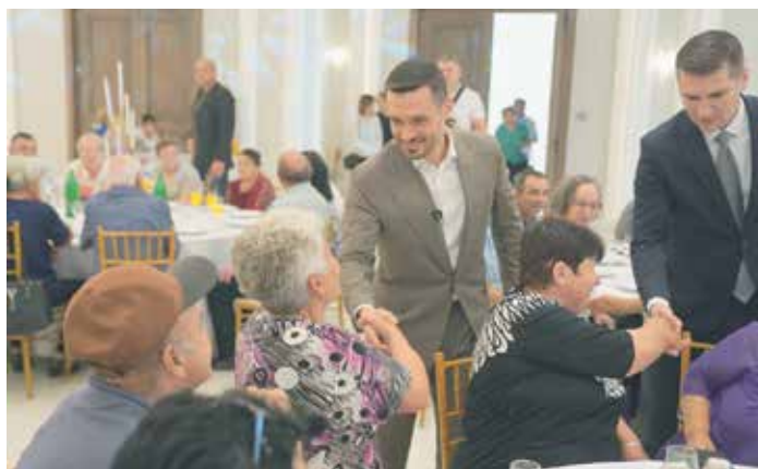
Сваки сусрет је прилика за разговор: трибина у Пожаревцу

И трибина у Сомбору, одржана 16. јуна, показала је да су сусрети који пензионерима пружају прилику да у другачијем контексту искажу своја