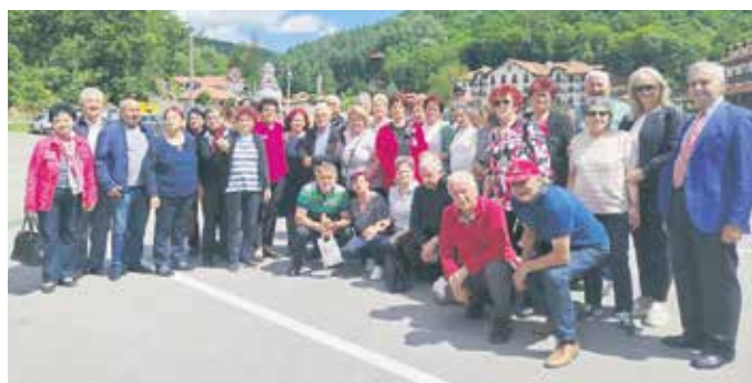
Сви задовољни виђеним и доживљеним

У цркви је један монах на присутнима обавио помазање светим уљем. По ста-