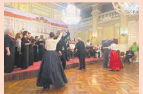
Хористи, плесачи и тамбураши на заједничком наступу

Концерт је још једном показао богатство културног суживота различитих нација и националности, па се певало и на мађарском језику, док је право изненађење приредио хор сомборских пензионера који је отпевао део јапанске песме „Вилин коњиц“ на изворном језику.