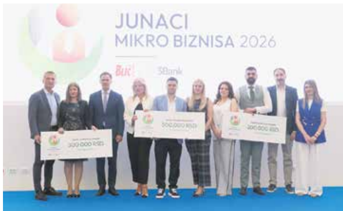
Министар Сениша Мали, представници институција и партнера са победницима конкурса Јунаци микробизниса 2026.

Победници су проглашени на свечаној церемонији у Привредној комори Србије, а подршку финалистима пружили су представници институција и партнера. Први потпредседник Владе Србије и министар финансија, Сениша Мали, поручио је предузетницима да су они покретачка снага Србије и инспирација за друштво, и истакао да ће држава наставити да ради на стварању стабилног и предвидивог пословног окружења кроз директне подстицаје, реформе и растерећење привреде.