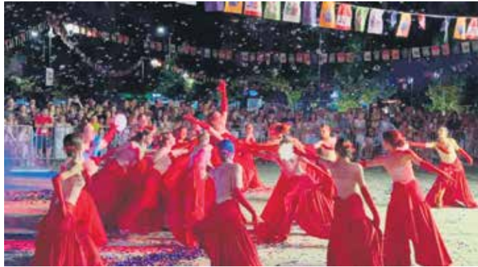
Награда за најбољу кореографију – Креативни студио Авангарда из Лесковца