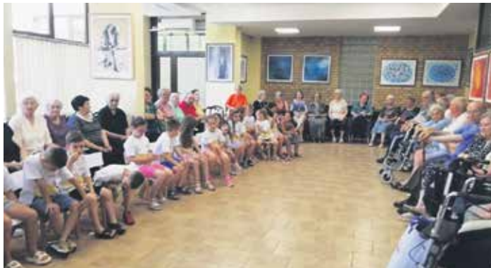
Клуб ће унапредити друштвени живот старијих Сомборца

Клуб међугенерациске солидарности је свакодневно отворен за потребе корисника, њихових породица и осталих особа старије животне доби са подручја града, као и за групе младих волонтера који су анга-