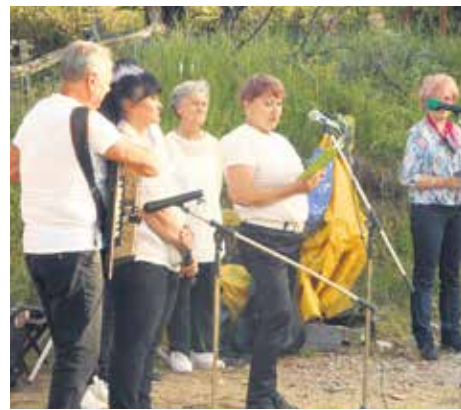
Група „Ћилим“ – одличан квартет пиротских пензионерки

Мештани Покровеника рекли су све најбоље о програму којим су пензионери увеличали славу села.