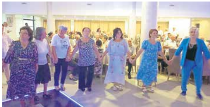
Прошле године чланови Удружења пензионера Врања славу обележили весело

Српски и македонски побратими поново ће се дружити у Врању 19. августа. На велики хришћански празник Српске православне цркве Преображење Господње врањска пензионерска организација обељежиће свој дан и славу. Ето