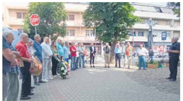
Књажевачки пензионери обележавају важне историјске датуме – Дан борца

У организацији Удружења пензионера града Лесковца одржана је 15. по реду манифестација Међународни фестивал фолклора трећег доба. На фестивалу су учествовала бројна удружења, а пензионери књажевачког удружења и КУД „Сунчана јесен“ представили су се играма из свог краја, односно играма из Књажевца и Буцака. Још једно признање овом удружењу stigло је као потврда марљивог труда и рада.