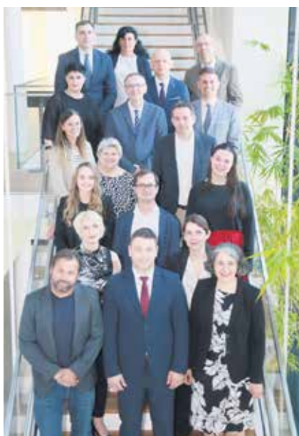
Учесници разговора органа за везу Републике Србије и Републике Аустрије у јуну ове године у Бечу