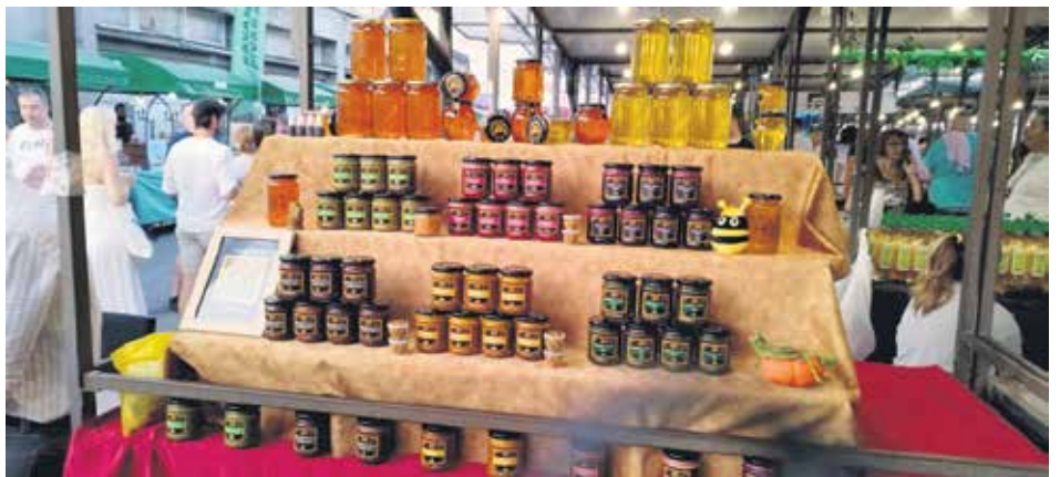
Београдски ноћни маркет одржан у јулу на пијаци Скадарлија (Бајлонијева пијаца)

купаца. Такође, подстицу и туризам привлачећи посетиоце који желе да искусе локалну културу и храну.