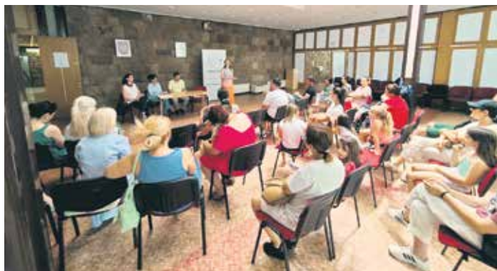
Програми усмерени на оснаживање породице: Мала школа за децу и родитеље

Ове године програм Мала школа за децу и родитеље организован је у Врњачкој бањи, од 21. до 23. јуна. Учествовало је 15 деце и 11 родитеља из разних крајева Србије. Родитељи су