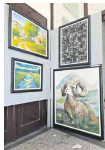
Слике са 20. Ликовне колоније изложене у холу Центра за туризам, културу и спорт Сврљиг

Последњег дана трајања Ликовне колоније у холу Центра за туризам, културу и спорт приређена је изложба ликовних дела насталих на овој манифестацији. Центру је на чување и бригу остављено око 30 слика које су нашле своје место у његовој Галерији.