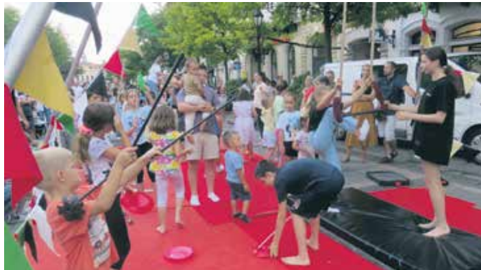
Чланови „Креативног погона“ учили малишане циркуским вештинама

Ко се то вече затекао на сомборском корзоу, могао је да уочи и оригиналне непомичне људске статуе и да се крај њих фото-