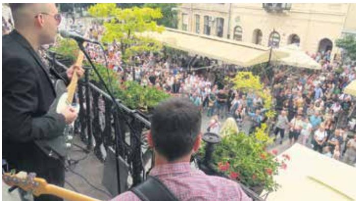
Целовечерње уживање у ритмовима џеза, блуза, рока

Највећа сомборска пешачка променада у центру града је, 20. јула, била место окупљања више од тридесет уметника и бендова, на сада већ традиционалној манифестацији „Вече уличних свирача“.