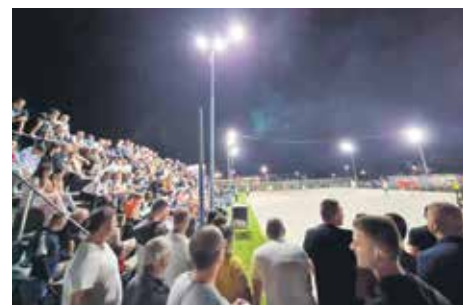
Видовдански турнир у фудбалу увек привуче много гледалаца

Спортски центар „Пастириште“ стално се изграђује и улепшава. Недавно је Министарство грађевинарства, саобраћаја и инфраструктуре одобрило средства