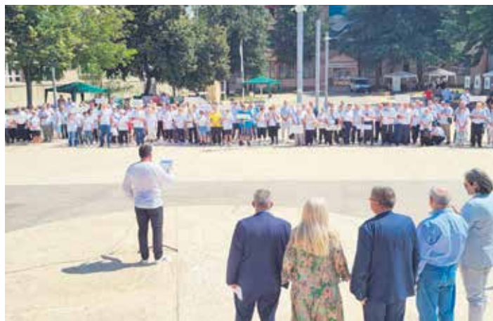
На надметању пензионера у Нишу више од 200 учесника

Оцена свих учесника је да су овакве и сличне манифестације неопходне старијима и да су дружење са својом генерацијом и лепа атмосфера током надметања победницима и овог спортског сусрета. Ипак, свако такмичење подразумева и поене и победнике, а у Нишу су резултати били следећи: у кошарци су три прва места заузеле екипе из Грачанице, Нишке бање и Беле Паланке; у фудбалу су најбољи били спортисти из Бабушнице, а друго и треће место припало је нишким општинама Палилула и Медијана. У дисциплини штафета два прва места освојиле су екипе из Нишке бање, док је трећа била Бела Паланка. У пикаду су најбољи били такмичари из Бабушнице, друга је била екипа нишке општине Пантелеј, а трећи тим Градске организације пензионера Ниша који је у шаху био још бољи