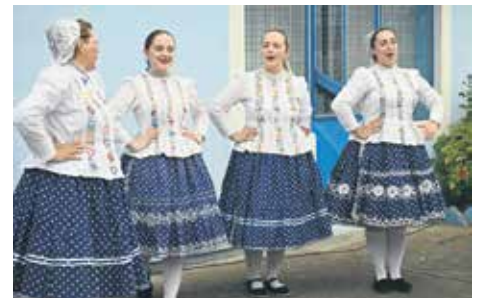
У културно-уметничком програму учествовала је женска певачка група „Јаношик“