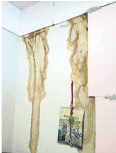
Влага и бућ нагризају зидове просторија Удружења

– Зграда површине близу 4.000 квадрата је запуштена и изузев Удружења нема других станара. Због тога је постала место окупљања бескућника, наркомана и других којима ту није место. Постоје три власника