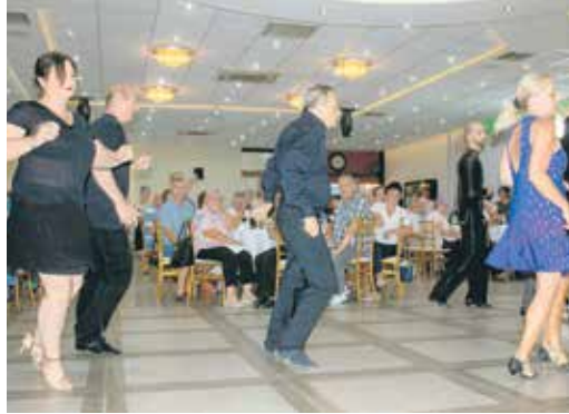
Нису им страни ни латино ритмови