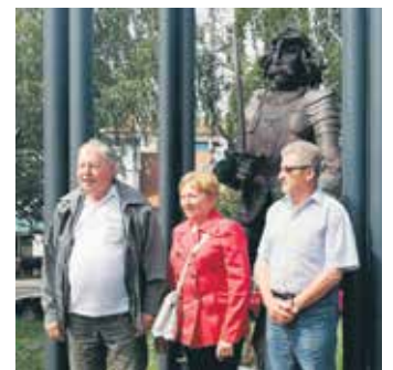
Положен венац на споменик Јанку Сибињанину (Јаношу Хуњадију) у Земуну

Нису занемарљиве ни историјске везе. У Земуну пензионери су посетили стари део града, кулу Гардош и споменик Јанку Сибињанину, Јаношу Хуњадију (1387-1456), који се налази крај Дунава на Кеју ослобођења. На споменик Сибињанину (Хуњадију), који је подигнут пре пет година, на годишњицу битке за Београд која је вођена 1456.