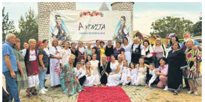
Учесници XI „Златних руку Косовке девојке“ у Лапљем Селу код Грачанице

У културно-уметничком програму учествовали су млади