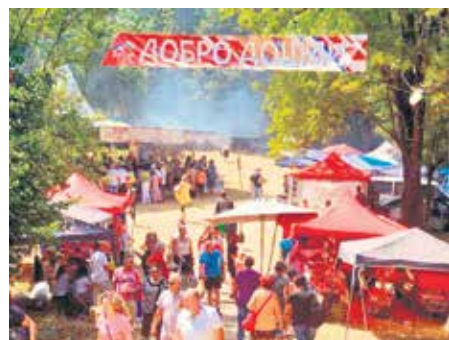
Сабор на Кадибогазу окупи више десетина хиљада посетилаца

На десетине излагача и са српске и са бугарске стране представили су своје производе купцима и гостима Сабора. Посетиоци су уживали у доброј храни, али и у културним садржајима обе земље јер су општине Књажевац и Белоградчик организовале пригодан културно-уметнички програм. Специјални део програма био