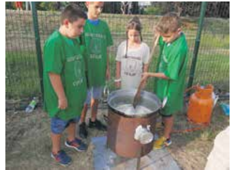
Најмлађа екипа у справљању белмужа

По оцени жирија овогодишњи победник у припреми белмужа је екипа „Кумови“, друга у укупном пласману је МЗ Драјинац, а трећа екипа „Плеш Белоње“. Ове године први пут је награђена и најмлађа такми-