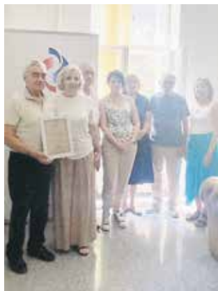
Представници Клуба „Желвоз“ са члановима редакције

Захвалницу за допринос у раду и реализацији акција Клуба пензионера „Желвоз“ и успешну пријатељску сарадњу представници ове пензионерске организације су, у просторијама Фонда у Београду, уручили запосленима који припремају овај лист у Сектору за односе с јавношћу РФ ПИО. Они су уз захвалницу добили и неколико вредних књига чији су аутори чланови Клуба „Желвоз“.