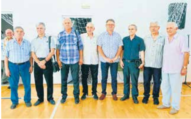
Представници Удружења пензионера града Ниша

Он, између осталог, истиче да је путем Фонда солидарности, који око десет година егзистира у оквиру Удружења, средства користио скоро сваки од 4.000 чланова Фон-