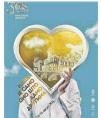
Противна фотографија овогодишњих Рашких духовних свечаности

Поред приказаних филмова и одржаних концерата, као и представа за децу, на овогодишњим Рашким духовним свечаностима врелих августовских дана Рашчане је најбоље освежило премијерно приказивање филма „Шабан Бајрамовић – моје путовање“ у режији Жељка Мирковића, да би завршено дана атмосферу на централном