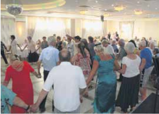
Сомборци и њихови гости умеју да се веселе