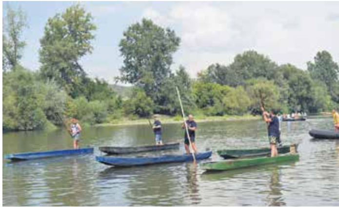
У чувеној трци чамаца с мотком такмичило се шест чамција

Програм манифестације почео је на шеталишту изложбом документарне фотографије под називом „Трстеник на Морави 2005-2023“. Уследио је и концерт „Једна песма, једна жеља“ у извођењу естрадних уметника. Своју вештину на платоу испред зграде општине демонстрирали су чланови Карате клуба „Прва петолетка“, а деца су имала своју ликовну радионицу „Лептирићи и вилин