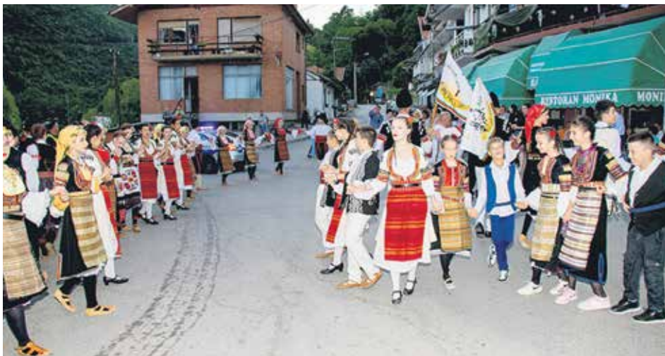
Седам дана фолклора и мултикултурализма у Босилеграду

– Фестивал који се одржава од 2009. године промовише традиционалну културу и фолклор и јача везе међу народима Балкана и Европе. Он представља значајан догађај за сиромашну и неразвијену општину Босилеград. Традиционална манифестација шаље јасну поруку да општина Босилеград тежи мултикултурализму, разумевању и толеранцији. Светковина у нашем граду добро представља фолклорну уметност и другим културама пружа прилику за промоцију својих обичаја и културе. За интеркултуралну размену и повезивање различитих култура кроз песму и игру општина Босилеград постаје значајан културни и туристички центар у Пчињском округу. Фолклористи се ухватје једно за друго, изгубе се вере и