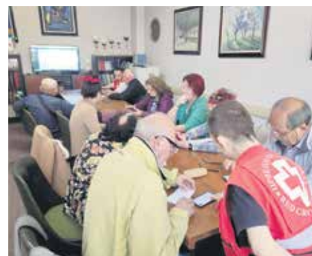
Највеће интересовање учесници обуке показали за коришћење е-Катастра непокретности

Ови тренинзи су део активности програма „ПРО – Локално управљање за људе и природу“, који заједнички спроводе аген-