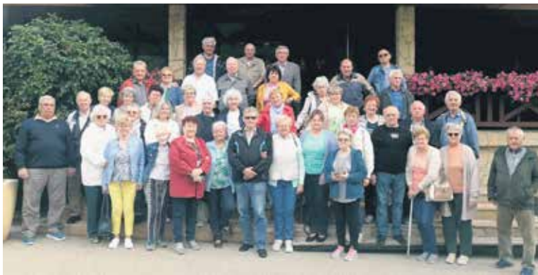
Пензионери из Кањиже и Орошхазе у Борковцу