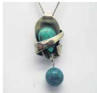
Привезак од кашике оплемењен полудрагим каменом

– Тешко, нарочито алпаку. Алпака је мешавина метала: бакра, никла, калаја, кадмијума, сребра, олова, од које се правио есцајг којим се служила грађанска класа. Има сјај и једно-