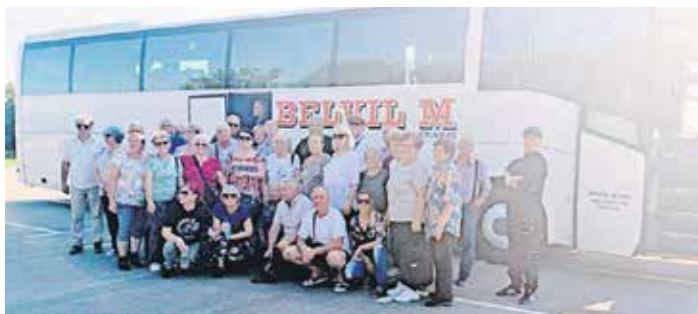
Пензионери „Ђеренке” уживају на сваком излету

– Програмом рада предвиђено је да ове године организујемо шест једнодневних посета значајним местима српске историје, културе и туризма. Иза нас су остале три једнодневне екскурзије. Удружење са 1.500 динара од годишње чланарине дотира трошкове боравка сваког нашег члана на екскурзијама. Поносимо се што пензионери „Ђеренке” на овим излетима уживају, друже се и тако побољшавају свој квалитет живота – рекао је председник