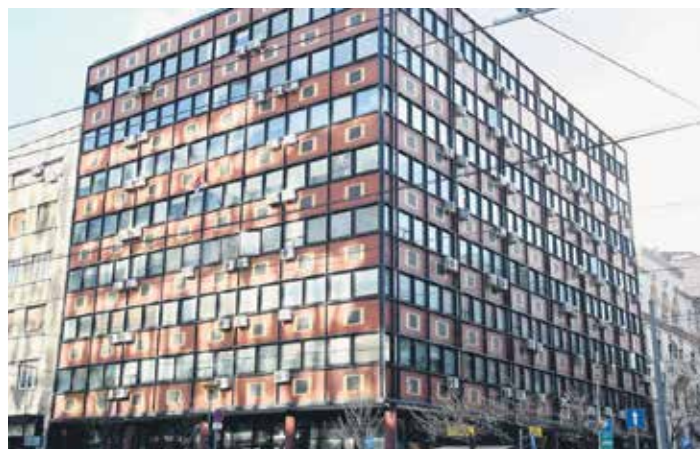
Филијала РФ ПИО за град Београд

Законом о социјалном осигурању радника, намештеника и службеника донетим 13. августа 1946. уведено је тзв. државно социјално осигурање, засновано на принципу финансирања средствима доприноса који плаћају послодавци и запослени, при чему је држава била гарант свих права, односно давања из овог осигурања. Као параметри за одређивање висине и обима права у обзир су узимани трајање осигурања, тежина рада и просечна плата осигураника. Године 1950. донет је Закон о социјалном осигурању радника, службени-