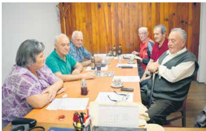
Са седнице Извршног одбора бајинобаштанског Удружења пензионера