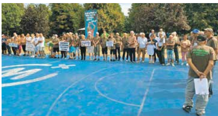
Надметање сениора Расинског округа организовало је Удружење пензионера Крушевац