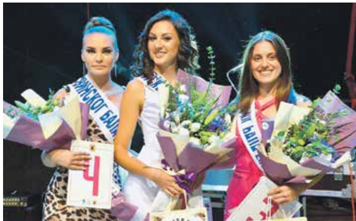
Велика конкуренција и у избору за Мис Винског бала