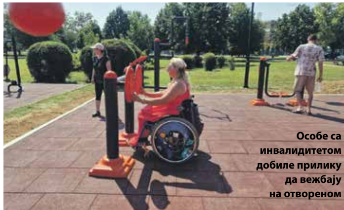
Особе са инвалидитетом добиле прилику да вежбају на отвореном

Теретана је намењена особама са инвалидитетом и могу је користити сви са територије Јабланичког округа. Свако ко посети Лесковац има прилику да сврати на ово вежбалиште које се налази недалеко самог