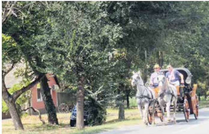
Увек атрактиван дефиле фијакера

Првог дана Великогоспојинских вечери одржана је и клиеријада, а у холу ОШ „Бранко