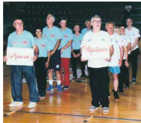
На надметању у Ариљу екипе свих 10 удружења из општина Златиборског округа

Сабирајући резултате у свеукупном пласману, победници Олимпијаде Ариље 2024.