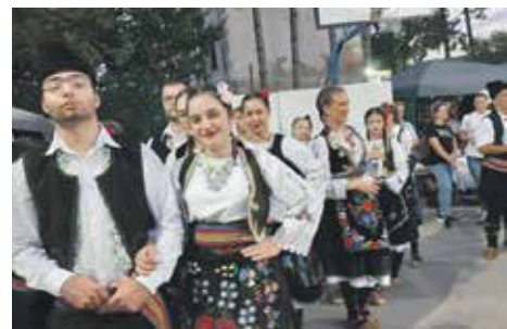
У богатом програму смењивале су се играчке групе

Свеукупни овогодишњи победник Сусрета села је село Плужина. Најбољи штанд поставило је село Лукавица – Шљивиовик, док је победник у шаху и шутирању пенала било Удружење пензионера Сврљиг. У пикаду су победили пензионери из Нишке бање, а пензионерке Удружења пензионера Сврљиг биле су треће.