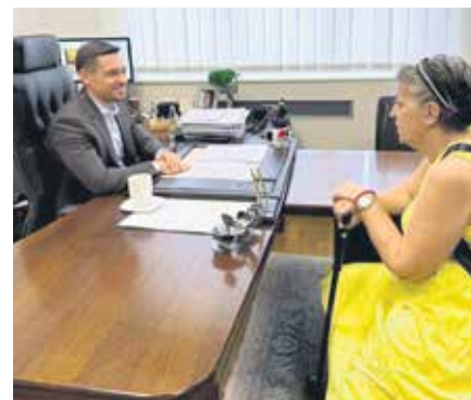
Странке су добиле одговоре и савете како да реше недоумице или проблеме које имају