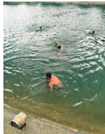
Буренце на дохват руке

Организатори су наградили и најбоље карикатуристе који су цртали на тему вина и виноградаре. Конкурс за најбољу карикатуру одвија се без прекида почев од 1994, а ове године пристигла су 24 рада и стручни