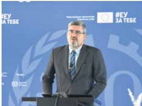
Министар Немања Старовић на представљању пројекта о социјалном дијалогу

Старовић је указао да је у времену економских, социјалних, технолошких и еколошких изазова веома важно да се оснажи култура дијалога и да се разговара језиком чињеница и аргумената.