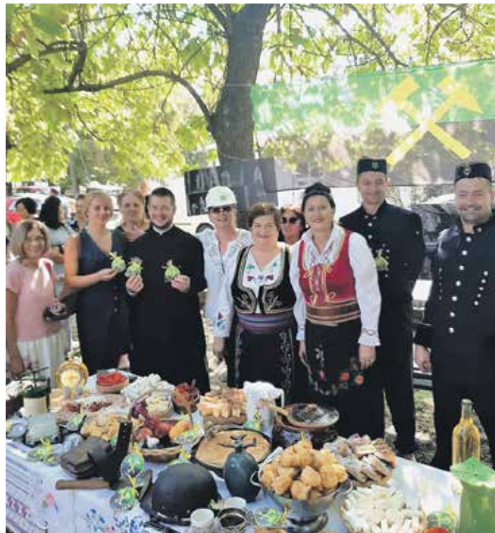
Штанд Ибарских рудника

– Хлеб са седам кора је хлеб живог човека рудара. Мало