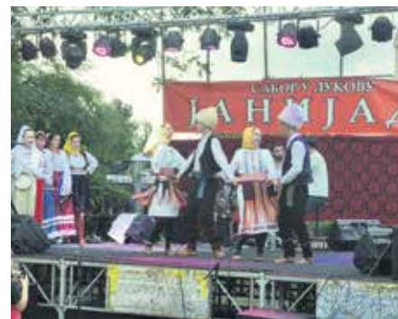
Луковски сабор постао познат надалеко

Сабор о коме се прича и препричава организовали су Месна заједница Луко-