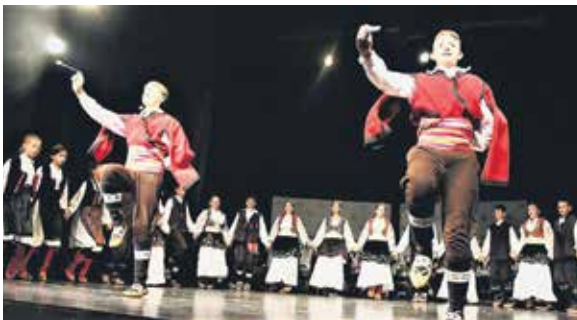
Наступ КУД-а „Мокра гора“

Веселим Колашинцима, као и ранијих година, али овај пут много већа и