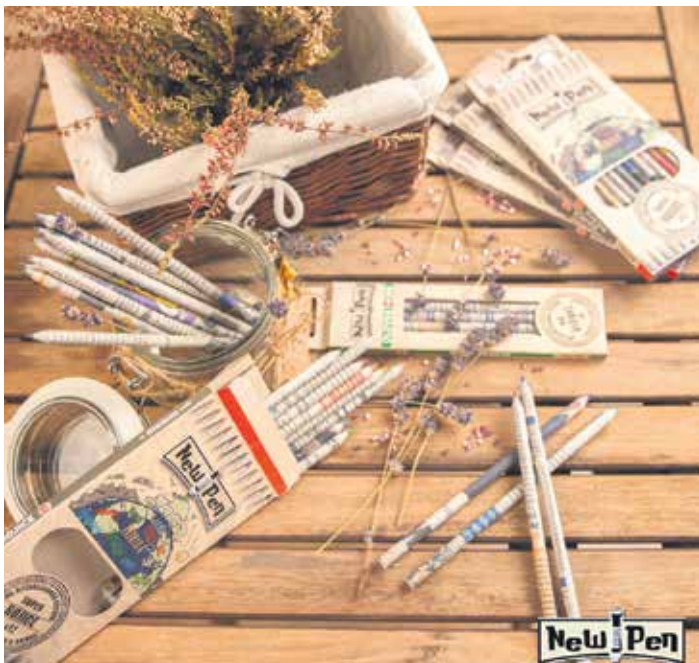
Крајњи производи и погон за производњу

Седам-осам месеци је трајало истраживање, а уједно и обућавање како се тај посао ради. Укључили су и два пријатеља у причу и тако је све кренуло