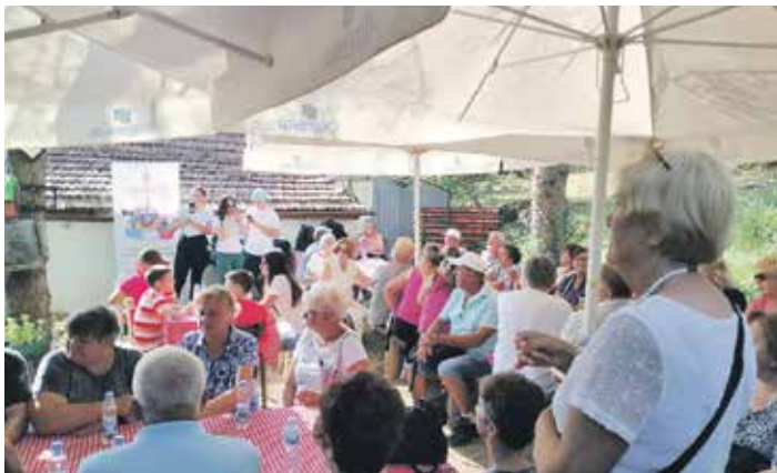
Освежење после шетње

Удружење пензионера града Новог Сада, у сарадњи са Удружењем особа са дијабетесом „Диаверзум” и новосадском Градском управом, организовало је, 24. августа ове године, акцију пешачења на Фрушкој гори под називом „Сви заједно”. Циљ ове акције је био да се најстаријим суграђанима укаже на важност физичке активности и здравог начина живота.