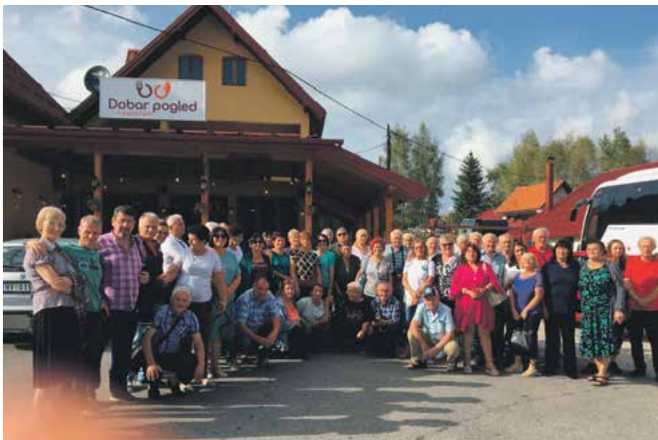
Пензионери Лознице су пасионирани путници

Иначе, Златарско језеро је вештачко језеро у долини Увца. Налази се између планине Златар и Муртенице, удаљено петнаестак километара од Нове Вароши. У историји језера постоји прича да су географи пре 1960. године добили задатак да учртају језеро знајући да ће оно потопити читаво једно село: куће, штале, воћњаке, лива-