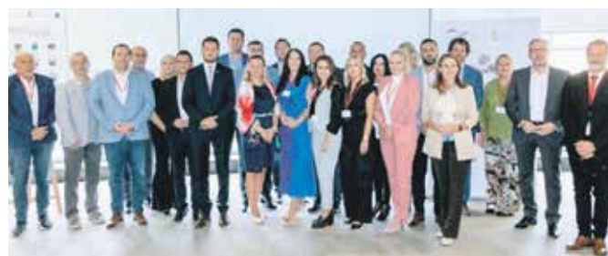
Учесници у пројекту потписали су Пано сарадње

У оквиру пројекта Немачке агенције за међународну сарадњу (ГИЗ) „Поддршка социјалном укључивању у Србији”, који реализује у партнерству са Министарством за рад, запошљавање, борачка и социјална питања, обележен је званичан почетак сарадње са 20 локалних самоуправа које ће, заједно са другим партнерима, радити на унапређењу услуга социјалне заштите у Србији. Активно учешће на пројекту има и Министарство за људска и