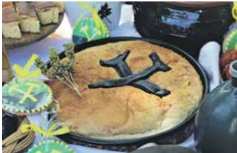
Рударски хлеб са седам кора