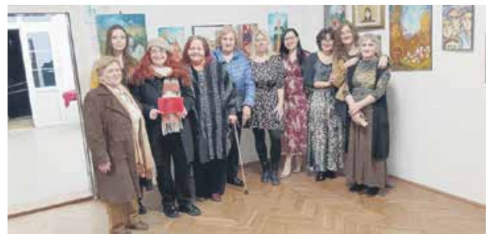
Трстеничке уметнице суграђанима посветиле 35 нових дела

– Сваке године поводом 8. марта, Дана жена, наше чланице излажу своја дела, овога пута њих 20 је изложило 35 радова различитих сликарских техника. Изложбу су посветиле својим суграђанима, а наравно и осталим љубитељима ликовне уметности. Тако традиционално одајемо признање женама које су временом оставиле неизбрисив траг у свим областима у којима су биле присутне. Оне су својом креативношћу, радом и залагањем дале велики допринос и раду нашег удружења, на