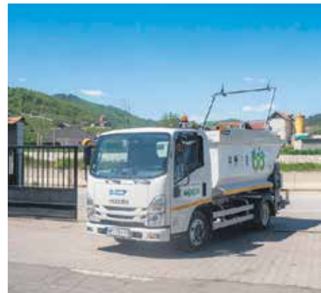
Специјализовано возило за прикупљање текстилног отпада ЈКП „Градска чистоћа“ Нови Пазар

У овом процесу, истиче се, најбитнија је примарна сепарација – одвајање отпада на самом месту његовог настајања, а крајњи резултат процеса је смањење загађења животне средине, као и помоћ текстил-