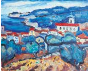
Касис, 1930, уље на платну, 54x64,5цм, приватно власништво

Своје најдраге слике је још за живота завештао родном граду Сомбору, сматрајући да оне њему и припадају, те је тако давне 1965. сачињен Уговор о