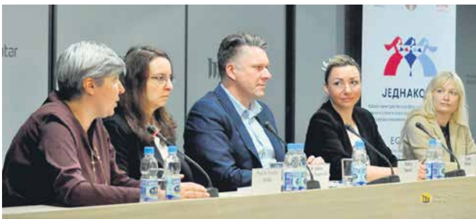
Конференцијом је обележен завршетак пројекта „Превенција насиља над старијим женама“

Скоро 40 одсто жена старијих од 65 година биле су жртве насиља у кући или на јавном месту, или су насиље доживеле као сведоци – резултати су истраживања из публикације „Насиље над старијим женама – последњи табу“. Чешће жртве насиља су биле жене које живе у руралним подручјима (скоро половина испитаних); затим које су нижег нивоа образовања (53 одсто са основним образовањем); које су се суочавале са материјалним тешкоћама и