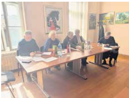
На седници је изабран председник и Организациони одбор 18. Сабора пензионера – Олимпијаде трећег доба Србије Врњачка Бања 2025

Током дискусије која се односила на усвајање Програма примећено је да ће манифестација од сада у свом имену садржати, како је образложено, „народску реч“ – сабор, а ове године биће одржана у периоду од 30. септембра до 3. октобра. Усвојене су и сугестије да другог дана Сабора у оквиру Базара здравља буде уприличен мини сајам, а у остатку дана и панел-дискусија на тему екологије.