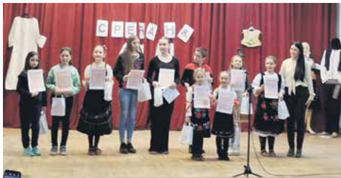
Написали и насликали најбоље радове о мајкама