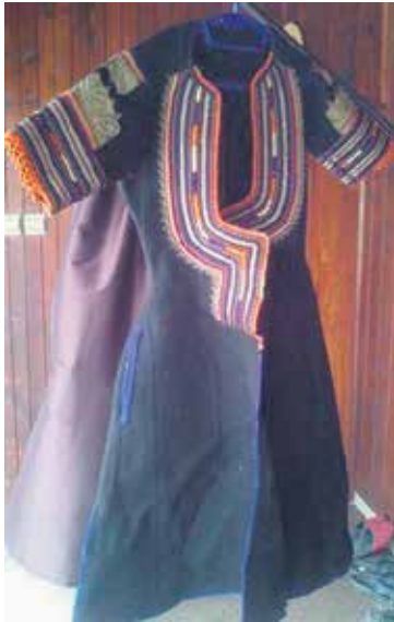
Чувена црна женска хаљина „саја“

Када се каже женска народна ношња босилеградског крајишта, најпре се помисли на црну хаљину „саја“, коју су познати светски етнологзи својевремено прогласили за најлепшу у Европи. Центар за културу Босилеград и становништво Дуката, Жеравина, Јарешника, Караманице, Мусуља и других села деценијама чувају хаљине специфичног кроја и кратких рукава, симбол етничког идентитета, културног наслеђа