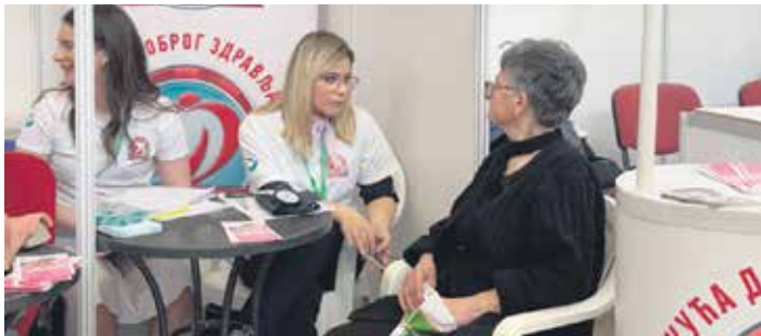
Заинтересовани грађани могли су да провере вид, крвни притисак, ниво шећера

Велико интересовање је било за бесплатне здравствене прегледе. Наиме, у оквиру сајамског програма нишки Дом здравља и Црвени крст имали су посебне пунктове на којима су посетиоци могли да се посаветују са струч-