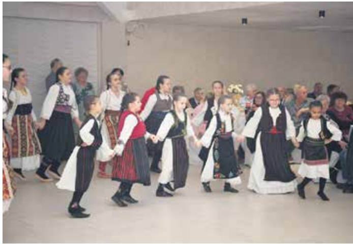
Наступ КУД „Ратко Павловић Ћићко“ из Раткова