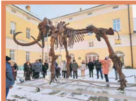
Мамутица Кика је јединствен археолошки експонат у свету

А тога је било напретек: од јата јединки сова начичканих у крошњама дрвећа у центру града, по чему је Кикинда позната широм Европе, преко јединственог млина, збирке скулптура од теракоте, до мамутице Кике старе пола милиона година. Једном речју, све набројано је оставило снажан утисак, а остала је недоуми-