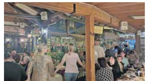
За 8. март обишли знаменитости, али се и веселили

Овом екскурзијом Удружење из Грачанице започело је овогодишњу сезону једнодневних и вишедневних путовања, која су саставни и незаобилазни део програма рада у области друштвеног стандар-