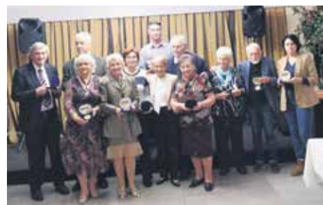
Добитници признања Удружења пензионера Банке Поштанска штедионица

уз одличну музику и сјајну атмосферу. УП Банке Поштанска штедионица поручује да ће и убудуће наставити своју мисију окупљања бивших запослених и подстицања дружења и међусобне подршке. Овај догађај је још једном показао колико је заједништво важно и како пензионери, након радног века, могу остати активни, повезани и важни за друштво у целини.