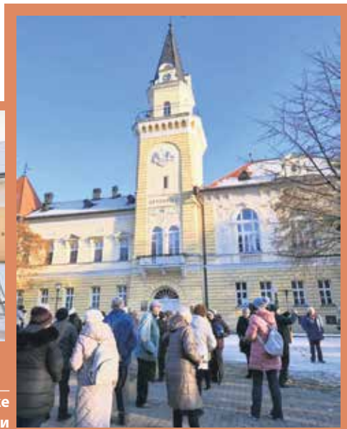
Пензионери испред Градске куће у Кикинди

ца који локалитет је заузео победничко место.