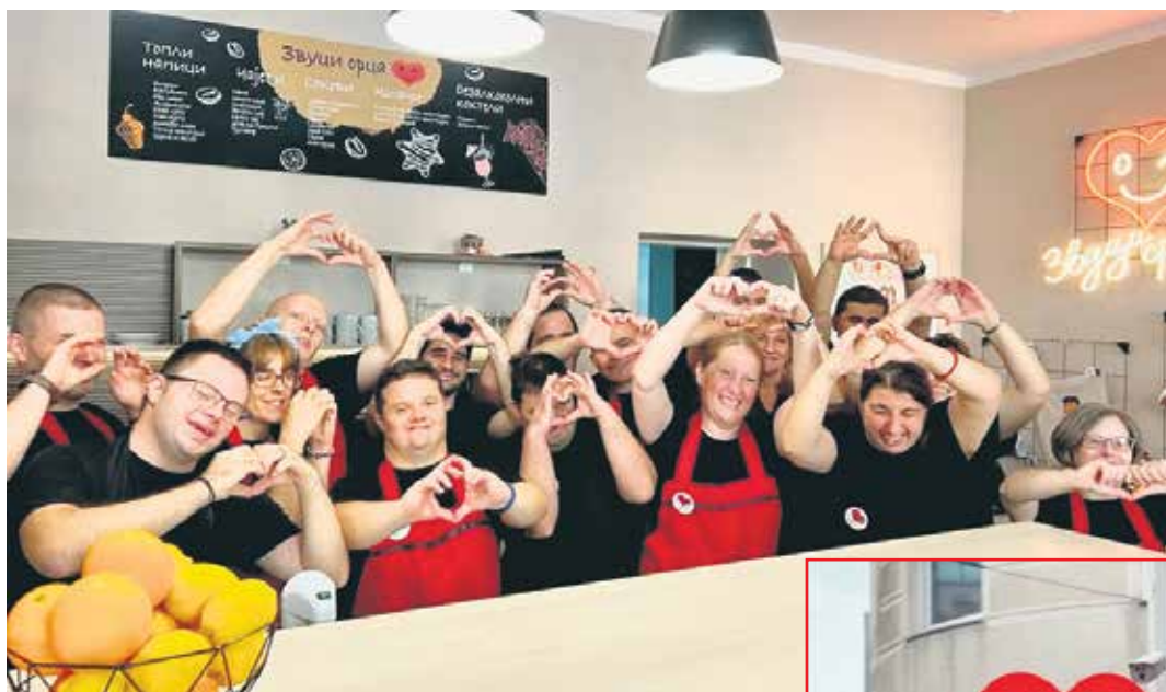
У кафићу „Звуци срца“ владају осмеси а цене не постоје