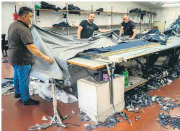
Текстилни отпад као неизбежан део производње фармерки

М ода је термин који означава популарне стилове у разним сферама људских активности и размишљања, у било које време у историји. За већину, мода је синоним за лепо и за оно што носимо, она се воли, прати, о моди се прича, мода је свуда. А да ли је то све што треба да знамо о њој? Поред свих информација мало је познато да су текстилна и модна индустрија на црној листи по питању животне средине, заправо у самом су врху међу загађивачима, други по реду, иза нафтне и гасне индустрије. Како и зашто – стручњаци кажу због велике производње и лошег квалитета. А чињенице говоре и следеће: сваке године се произведе готово 100 милијарди комада одеће – у просеку 14 одевних комада за сваког човека на планети; око 85 одсто произведеног текстила исте године заврши у ђубрету; прањем одеће велика количина микропластике заврши у океанима и морима; производна технологија доводи до значајног повећања загађења воде и земљишта, као и емисије гасова са ефектом стаклене баште. Још, текстилна и модна индустрија представљају велике потрошаче воде која се користи за пиће. У просеку, на годишњем нивоу се за ову производњу потроши 1,5 билиона тона воде, а за бојење и завршну обраду текстила око 200 тона воде за једну тону бојене тканине. Сврха овако поређаних чињеница није да се важност моде као „битне животне филозофије“ умањи, већ да се укаже на глобални проблем,