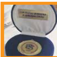
Плакету за успешну сарадњу добио је и Глас осигураника

Након доделе плакете уследио је свечани ручак и забава