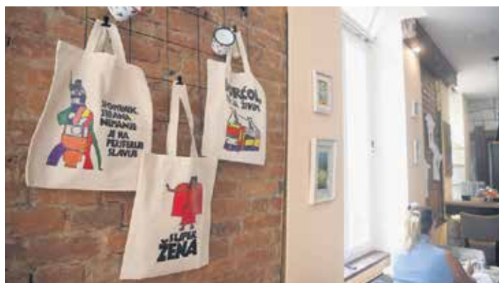
Производи настали у радионици „Срцотворница“