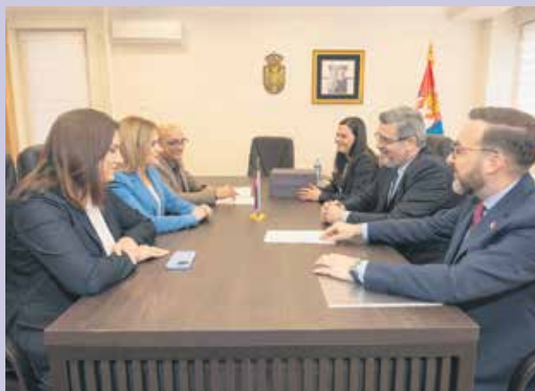
Примопредаја дужности у Министарству за рад, запошљавање, борачка и социјална питања

– Наставићемо и даље да посвећено и вредно радимо у служби грађана и њихове још