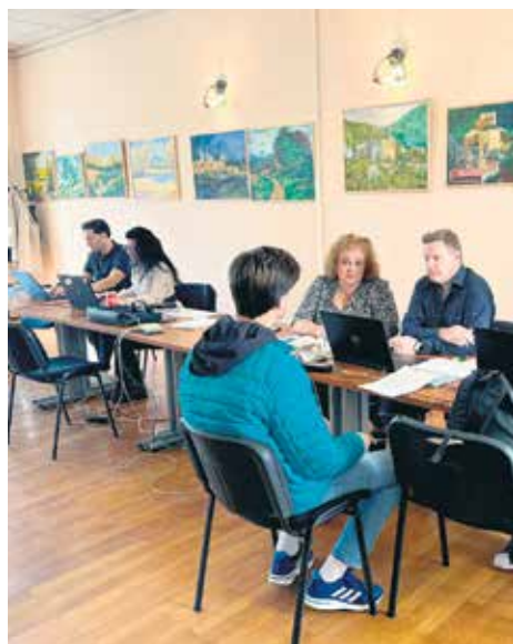
Директним разговором до решења проблема

На пољу међународне сарадње фондова за пензијско и инвалидско осигурање месец април резервисан је за сусрет референата Републичког фонда ПИО са представницима аустријског Завода за пензијско осигурање. Тако су први овогодишњи Дани разговора представника српског и аустријског носиоца осигурања са грађанима одржани 8. и 9. априла у Београду.