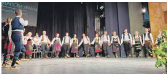
На концерту су се представиле различите генерације фолклораша

која нас је подржавала аплаузима. Било је ово незаборавно вече у знаку песме, игре и традиције. Желели смо публици да покажемо наш богати репертоар од оснивања до данашњих дана. Истичем наступ првог извођачког ансамбла, а своје кореографије представили су и ветерани нашег КУД-а, као и дечија екипа, сијали смо сви истим сјајем. На сцени су се смењивале различите генерације фолклораша водећи тако публику кроз разне делове наше земље али и иностранства. Показали смо снагу и посвећеност Друштва, наставили путем нашег преминулог председника и кореографа Дарка Смилковића. Наше вишедеценијско постојање имало је велику улогу