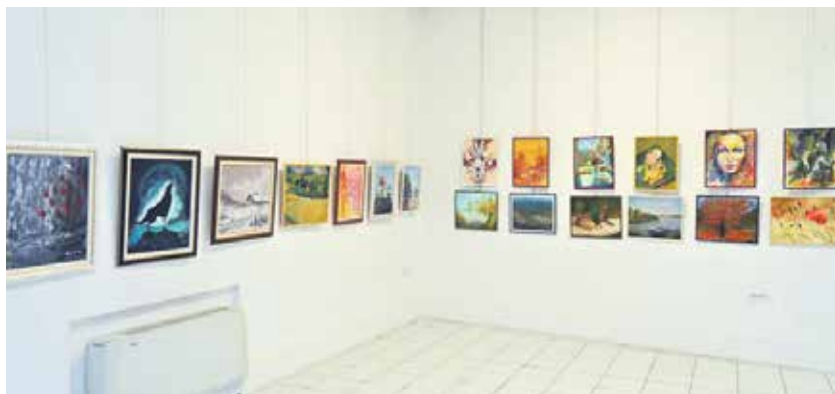
На изложби су приказана дела изузетног умећа и имагинације