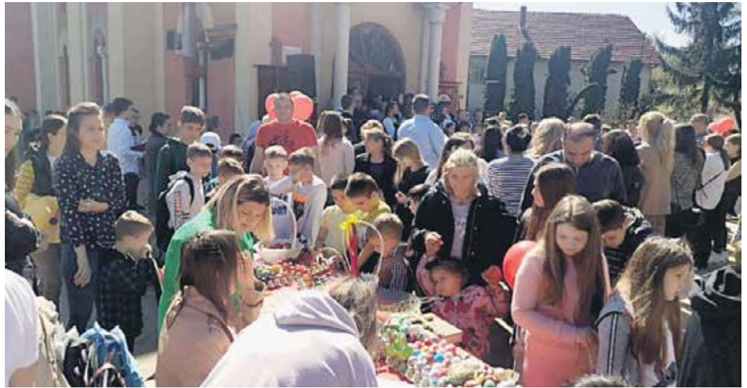
Хуманитарна продаја ускршњих јаја и дечијих рукотворина

Хуманост, дружење, ускршње радости на сваком кораку. Разноврсна понуда хране и пића и чувени сврљишки специјалитет белмуж. На манифестацији је учествовало више од хиљаду грађана, а изложено је близу две хиљаде ускршњих јаја. Одржана су и такмичења у куцању ускршњим јајима, иза-