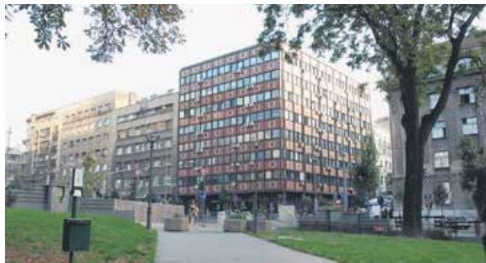
Зграда у Немањиној 30 уврштена у споменике културе Србије

Директор Филијале истиче да су све услуге доступне у потпуности на новој локацији, а контакт телефони и мејл адресе су остали непромењени.