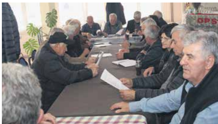
Са седнице Скупштине УП Грачанице

Ово је записано и у извештају о раду УП Грачанице, за период од априла 2024. до априла