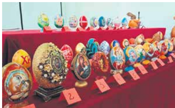
Подршку аукцији дало је 20 учесника из приватног и јавног сектора

– Желим да захвалим свим учесницима ове хуманитарне аукције на којој је про-