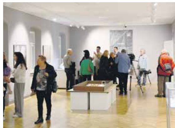
Изложба „Претке нам узвиси“ изазвала велико интересовање Румљана

Изложба ће бити отворена до 10. маја, а посетиоци имају прилику да завире у свет раног средњег века и упознају се са наслеђем предака који су обликовали историју ових простора. Г. О.