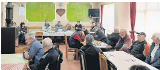
У Удружењу пензионера Сврљиг задовољни резултатима у прошлој години