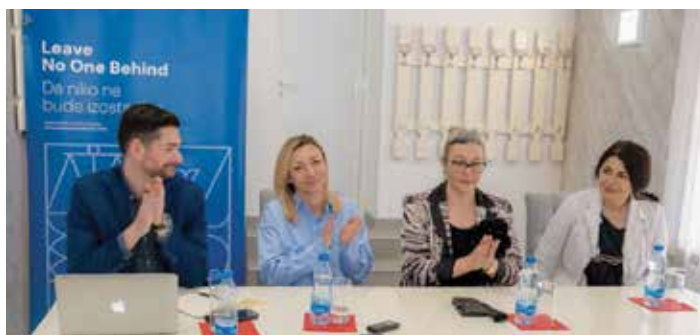
Порука из Мрчајеваца: удружења жена су важан вид оснаживања

– Покретање бизниса је једна од тема која је увек занимљива, а ово је регион богат предузетницима и предузетницама.