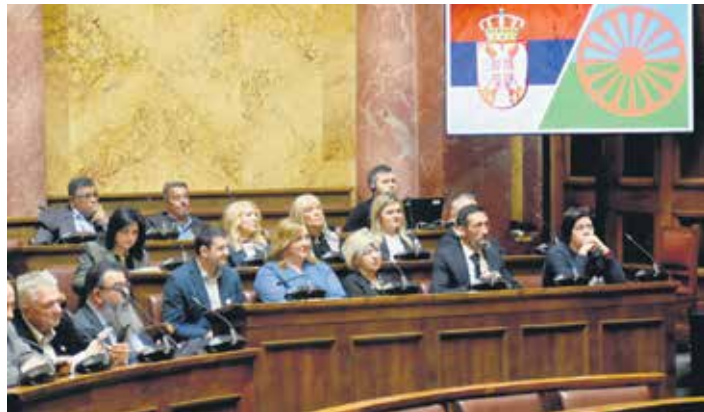
Свечано обележавање Дана Рома у Народној скупштини Републике Србије