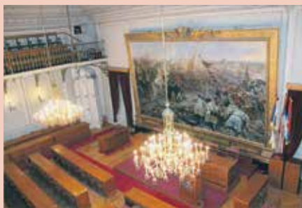
Највећа слика у Србији: „Битка код Сенте“

Било је више покушаја да се слика однесе из Сомбора, али је она до данас остала на месту где је и постављена. Пре тачно 123 године, градске власти Сенте упутиле су Бачко-бодрошкој жупанији молбу за уступање слике али је она одбијена. После Првог светског рата Мађарска је тражила да дође у посед слике, али је изгубила спор пред Међународним судом у Хагу. Пробало се са том идејом и у Новом Саду 1939, а ту намеру је прекинуо рат. Након Другог светског рата предложено је да слика буде предата београдском Народном музеју, чији је управник тада био Сомборац Вељко Петровић, коме није падало на памет да слику измести из родног града.