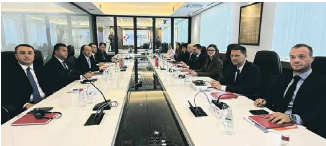
На радном састанку представника два фонда дефинисане су кључне тачке сарадње