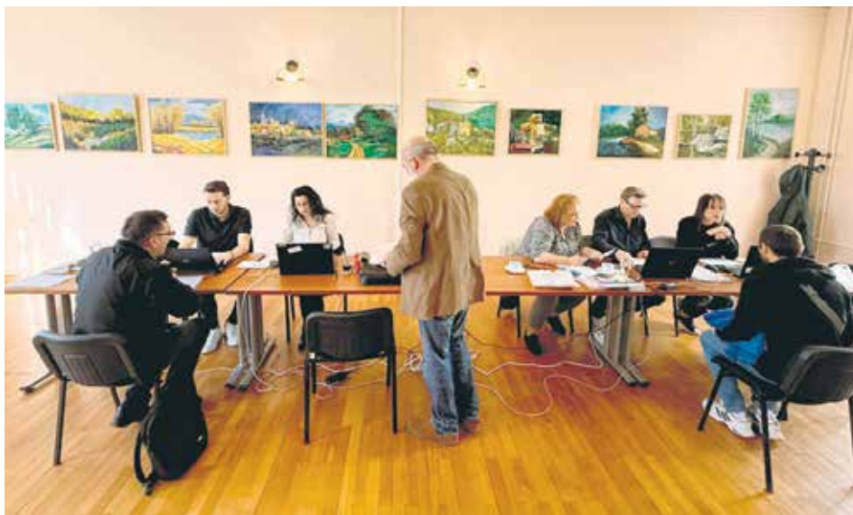
Дани саветовања су најједноставнији начин да се дође до потребне информације

Тако је и на овогодишњим саветодавним данима неколико десетина наших грађана, корисника аустријске пензије, од домаћих и референата аустријског Завода за пензиј-